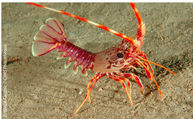
LANGOUSTE ROUGE, MER MÉDITERRANÉE