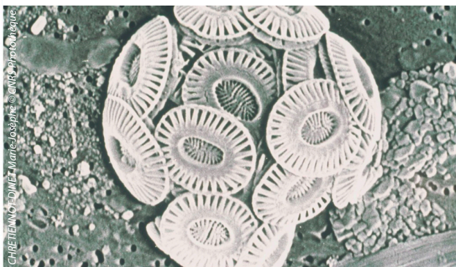
COCCOLITHES : MICROORGANISMES MARINS ET PLANCTONIQUES (5 microns)