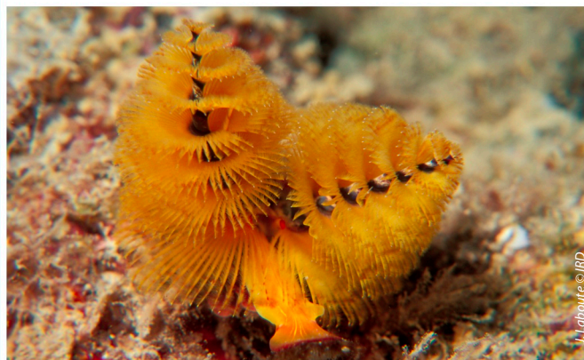
VER MARIN DE NOUVELLE-CALÉDONIE