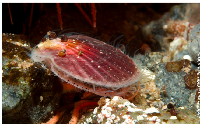
PÉTONCLE AUSTRAL, TERRE ADÉLIE