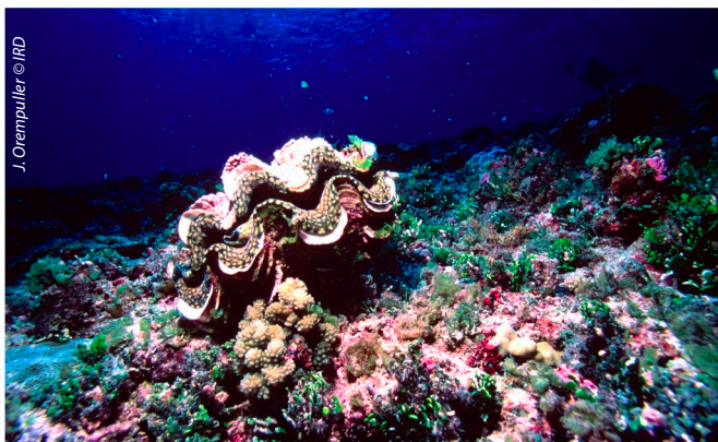
BÉNITIÉ DE POLYNÉSIE FRANÇAISE