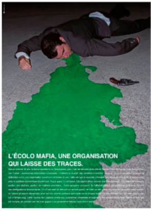
L'ÉCOLO MAFIA. UNE ORGANISATION QUI LAISSE DES TRACES.

Depuis près de 30 ans, la mafia napolitaine, la 'Ndrangheta, gère (mal) les déchets de la ville de Naples (7500 tonnes par jour). Aujourd'hui, ces mafias - puissances financières colossales - infiltrent la plupart des secteurs d'activité « légaux ». Pour Francesco Forgione, la distinction entre une organisation purement criminelle et une mafia est que la seconde entretient des rapports structurés et permanents avec le système économique et politique. Aucun pays n'y échappe. Cet argent afflue vers les marchés porteurs : extraction de minerais, gestion des déchets, gestion de matières premières... Cette gangrène se nourrit de l'affaiblissement des politiques publiques comme des dérégulations économiques. Or s'il est aisé de détruire un service public, en bâtir un est une autre paire de manches : cela requiert du temps (plusieurs décennies) ainsi qu'une volonté politique sans faille sur la longue durée. Or nos sociétés ont des difficultés à agir sur le temps long. Cette myopie de l'urgence profite aux puissances criminelles et augmentent les formes d'insécurité. Même si le temps est compté, en prendre permet d'en gagner. Les générations futures nous diront merci.