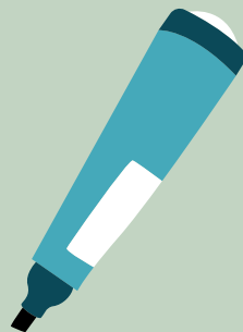
Schéma (peut être remplacé par une maquette) et définitions plastifiés